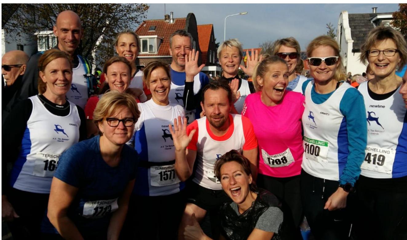
Gemzeninvasie op Terschelling