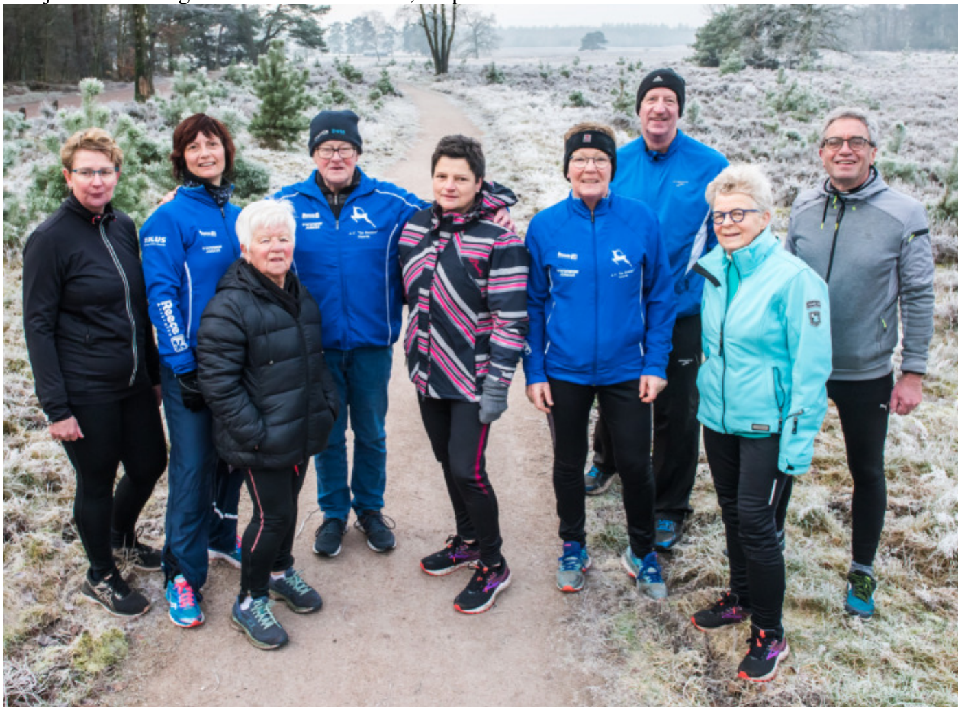
Het merendeel van de zaterdagochtendgroep na de training op 28 december

Er is eigenlijk geen betere manier om je weekend te beginnen, dan een lekkere training in de vroege ochtend. Dat weten de leden van zaterdagochtendgroep in Heerde maar al te goed. Om 8.00 uur wordt er verzameld bij de Kiosk aan de Elburgerweg om vervolgens onder leiding van Hennie Huiskamp een uurtje lekker door de bossen en over de hei te lopen. Om 9.00 uur is men weer terug bij de Kiosk. Het belangrijkste van de dag is dan al gedaan en de dag moet eigenlijk nog beginnen! Een onbetaalbaar lekker gevoel. De groep is wel wat kleiner geworden de laatste jaren, maar het enthousiasme is onverminderd groot. De training is zo opgezet dat iedereen mee kan. De snellere lopers lopen gewoon een extra rondje of lusje. Zo krijgt iedereen de training die bij hem/haar past. Wil je dat lekkere gevoel ook eens ervaren, loop dan mee!